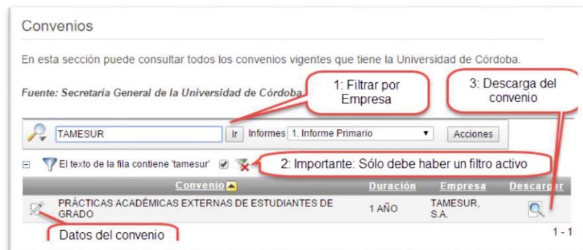
Figura 1. Acceso a los convenios educativos. Portal de transparencia de la Universidad de Córdoba.

Si deseas conocer los convenios de prácticas, pulsa en este enlace y sigue las instrucciones: