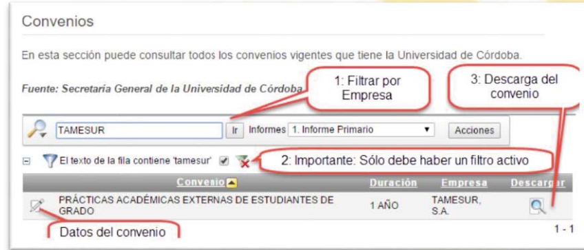
Figura 1. Acceso a los convenios educativos. Portal de transparencia de la Universidad de Córdoba.

-En relación a “información completa sobre tutores en la empresa y su cualificación”: Acción de mejora ya iniciada. Se ha añadido junto a los datos completos de cada oferta ( http://www.uco.es/eps/novedadesempleo > ver oferta completa) el campo Tutor . No obstante, en lo referente a la cualificación del Tutor, dado que el tipo de información que se solicita para las prácticas, desde la firma del convenio Universidad-Empresa hasta la adjudicación al alumno está definida y gestionada por la Oficina de Coordinación General de Prácticas en Empresa y Empleabilidad ( http://www.ucoprem2.fundecor.es/ ), se ha solicitado, a través del Vicerrectorado de Planificación Académica y Calidad, que dicha información (cualificación de los Tutores) pueda ser publicada junto a la oferta de la práctica externa. En cuanto se disponga de dicha información, también será incorporada a los datos publicados de cada oferta.